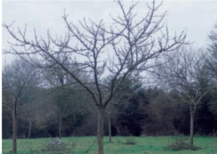
Pommiers après la taille