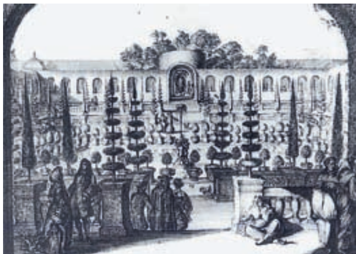
Topiaire à plateaux superposés, Romain de Hooghe, gravure, 17 e siècle

Le palissage permet d'établir des topiaires plus complexes dites «topiaires palissées» par accolage des rameaux ou par branches sur un support plat ou en volume. L'arcure